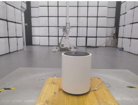
Measurement result summary